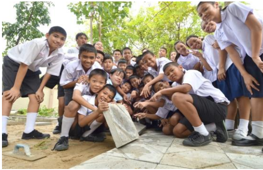
รูปที่ 6 แผ่นพื้นจากการนำคอนกรีตที่เหลือไปใช้ในบริเวณโรงเรียน [10]

4.2.3 R3.Recycle การนำกากคอนกรีตมาเข้ากระบวนการแยกหิน ทราย น้ำ และ นำกลับมาหมุนเวียนใช้ในการผลิตใหม่ เพื่อลดปริมาณกากคอนกรีตที่ต้องกำจัด ในกรณีนี้ต้องทำการทดสอบมวลรวม ได้แก่ หิน และ ทรายที่ได้จากการกระบวนการคัดแยกเพื่อนำกลับมาใช้ใหม่