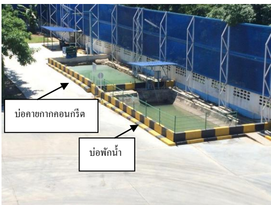
รูปที่ 4 บ่อพักน้ำและบ่อคายกากคอนกรีต

ปัจจุบันค่าใช้จ่ายในการนำกากคอนกรีตจากบ่อคายกากคอนกรีต ตามรูปที่ 3 และ รูปที่ 4 ไปยังสถานที่ฝังกลบ ระยะทางอยู่ระหว่าง 1 - 50 กิโลเมตร ค่าใช้จ่ายอยู่ที่ประมาณ 20,000 บาท ต่อ 1 เที่ยว (น้ำหนักของกากคอนกรีตประมาณ 15 ตัน/เที่ยว กรณีใช้รถบรรทุก 10 ล้อในการขนย้าย)