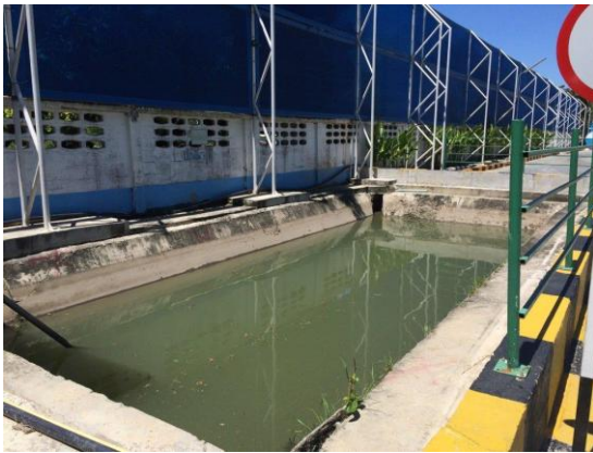
รูปที่ 3 บ่อคายกากคอนกรีต