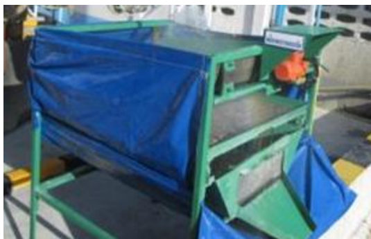
รูปที่ 7 กากคอนกรีตมาเข้ากระบวนการแยกหิน ทราย น้ำ [10]

4.2.3 R3.Recycle การนำกากคอนกรีตมาเข้ากระบวนการแยกหิน ทราย น้ำ และ นำกลับมาหมุนเวียนใช้ในการผลิตใหม่ เพื่อลดปริมาณกากคอนกรีตที่ต้องกำจัด ในกรณีนี้ต้องทำการทดสอบมวลรวม ได้แก่ หิน และ ทรายที่ได้จากการกระบวนการคัดแยกเพื่อนำกลับมาใช้ใหม่