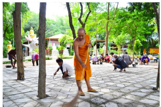
รูปที่ 5 แผ่นพื้นจากการนำคอนกรีตที่เหลือไปใช้ วัดใหม่ศรีสมบูรณ์ จังหวัดสุโขทัย [10]

4.2.2 R2.Reuse การนำกากคอนกรีตที่เหลือจากการทดสอบคุณภาพคอนกรีต โดยวิธีชัก Slump กลับมาใช้ใหม่ โดย ทำเป็นผลิตภัณฑ์อื่น เช่น แผ่นพื้น กระถาง ปลูกต้นไม้ โตะ เก้าอี้ ซึ่งจะมีการแบ่งตามอายุของคอนกรีตที่เหลือมาและจัดสรรว่าจะนำไปทำผลิตภัณฑ์ใดจึงมีความเหมาะสม ซึ่งนอกจากจะได้ประโยชน์ในเรื่องของการนำของที่จะเสียกลับมาใช้ประโยชน์ และสร้างมูลค่าเพิ่มแล้ว ยังสามารถนำไปช่วยเหลือ หรือมอบให้แก่ชุมชน วัด โรงเรียน เพื่อพัฒนาพื้นที่รอบๆ ให้มีความน่าอยู่มากขึ้น ตามรูปที่ 5 และ รูปที่ 6